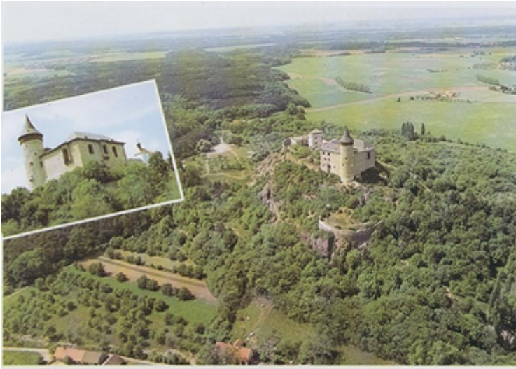
Pradl na Kuntlické hoře / Die Burg auf dem Berg Kuntlická hora / Castle on near Mount Kuntlická